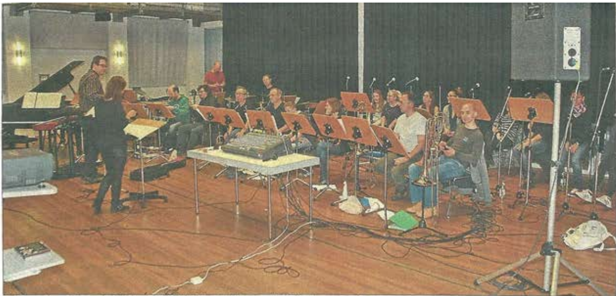
Seit über einem halben Jahr wird bereits für die beiden Aufführungen im Kulturforum geübt.